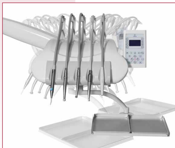
Detalle de las posibilidades de movilidad de la bandeja principal.